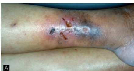
Gambar 4. Fenomena Lucio 9

Beratnya reaksi tipe 2 disebabkan oleh meningkatnya produksi sitokin oleh limfosit Th2 sebagai respons imun tubuh untuk mengatasi peradangan. Tumor necrosis factor alpha (TNF- \alpha ) dan interferon gamma (IFN- \gamma ) merupakan komponen sitokin spesifik pada ENL. Sirkulasi TNF yang tinggi terjadi pada reaksi tipe 2, diduga akibat sel mononuklear pada darah tepi yang dapat meningkatkan jumlah TNF. 2-4,8,11