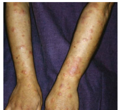
Gambar 3. Reaksi tipe 2/ ENL 9

Pasien kusta harus diedukasi mengenai risiko reaksi kusta tipe 1 saat mendapatkan pengobatan MDT, sehingga dapat mencari pertolongan. 2-4,8,10 Pengobatan reaksi kusta tipe 1 bertujuan untuk mengatasi inflamasi akut, rasa nyeri, dan kerusakan saraf. Pengobatan MDT seharusnya dimulai atau dilanjutkan pada pasien dengan reaksi kusta tipe 1 tanpa mengurangi dosis. Pasien reaksi kusta tipe 1 ringan diobati dengan analgetik dan sedatif bila perlu, reaksi kusta tipe 1 berat diobati dengan kortikosteroid oral 30-40 mg setiap hari selama satu bulan dan diturunkan 5 mg tiap bulan. 2,3,4,8,10